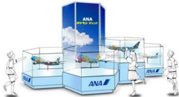
〈ポケモンジェットモデルプレーン展示 イメージ〉