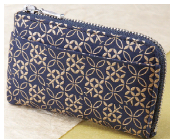
機内販売品「印傳 コインケース」 (「印傳」とは鹿革に漆で柄付けを施す伝統工芸品です)

ANA は機内で販売する特定商品の売り上げの一部を、ユネスコへ寄付致します。2014 年 9 月以降、国際線の機内販売において、日本が誇る伝統工芸品「印傳(いんでん)」のコインケースの売り上げの一部をユネスコへ寄付致します。詳しくは ANA ホームページをご参照ください。