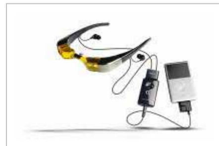
次世代パーソナルエンターテインメント「Myvu」

飛行時間の長い東京・大阪(伊丹・関西) = 沖縄線限定で、限定番組を搭載した iPod と次世代エンターテインメント「Myvu」(マイビュー) を有料レンタルいたします。眼鏡のように装着する「Myvu」なら、目の前に広がる自分だけの画面でショートムービー・ゴルフ番組・音楽ビデオクリップなど国内線機内でもゆったりと映像や音楽をオンデマンドでお楽しみいただけます。