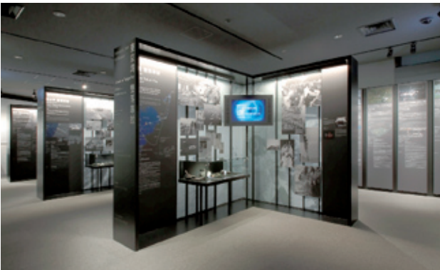
ANAグループ安全教育センター 館内