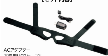
ACアダプター 充電用USBケーブル