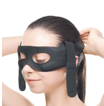
③サイドのバンドを斜め上へ引き上げ、固定します。