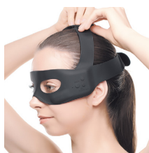
④上部のバンドを頭頂部で固定し、お好みのモードを選択。