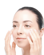
①化粧水でお肌を整えます。