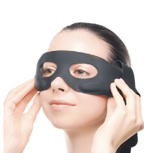
②アイホール部分と下まぶたのきわを合わせます。