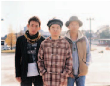
FUNKY MONKEY BABYS