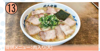
13 提供メニュー:肉入り(大)

徳島県鳴門市撫養町齋田岩崎56-1/アクセス:JR撫養駅から徒歩8分/火曜日休、月1回月曜日休/平日11:00~15:00、17:00~20:00土日祝11:00~20:00/☎088-685-2333