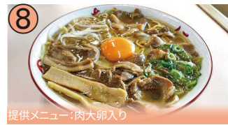
8 提供メニュー:肉大卵入り