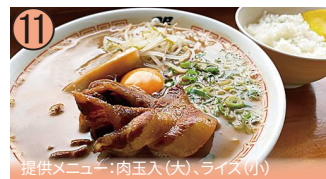
11 提供メニュー:肉玉入(大)、ライス(小)

徳島県徳島市銀座10/アクセス:JR徳島駅より徒歩12分/毎週月曜日休(祝日営業、翌日休業)/11:00~16:00/☎088-652-2340