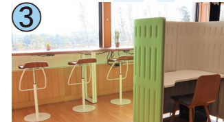
3 アグリコワーキングスペース オフィスあいさい

徳島県勝浦郡勝浦町大字沼工字中筋11-12(かんきつテラス徳島内)/アクセス:西岡停留所バス停から徒歩15分/土日祝休、年末年始休/9:00~17:00/☎050-3438-9115