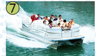
7 周囲約6km、20分の船旅をお楽しみください!

徳島市を囲む新町川・助任川などを周遊する遊覧船です。水の都・徳島のゆったりとした景色や川にかかるたくさんの橋を遊覧船から満喫して頂けます。徳島の川の風を体感してみてくださいね。