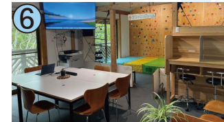
6 上勝ベンチャーHUBステーション

徳島県小松島市立江町炭屋ヶ谷47-3/アクセス:あいさい広場バス停/土日祝休、第3火曜日休、年末年始休/8:30~17:00(受付15:00まで)/☎080-2428-9150