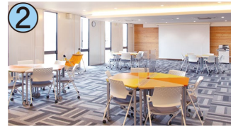
2 交流拠点施設マツシゲート

徳島県名西郡神山町下分字地野49-1/アクセス:神山高校前バス停から徒歩8分/土日祝休(臨時休館あり)/9:00~17:00/☎050-2024-4385