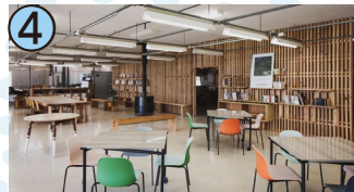
4 神山バレー・サテライトオフィス・コンプレックス

徳島県徳島市元町1丁目24 アミコ9階/アクセス:JR徳島駅から徒歩3分/毎週火曜日休、年末年始休/10:00~21:00/☎088-635-9002(ツーリズム徳島)