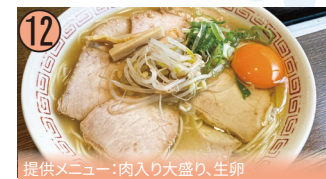
12 提供メニュー:肉入り大盛り、生卵

徳島県徳島市住吉5丁目68-1/アクセス:城東大橋バス停、西張北バス停から徒歩4分/毎週水曜日休/10:30~15:00(土日~17:00)/☎088-653-3839