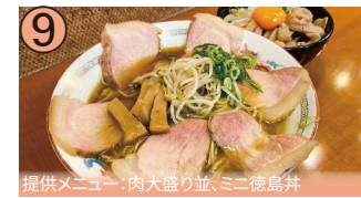
9 提供メニュー:肉大盛り並、ミニ徳島丼

徳島県徳島市西大工町4丁目25/アクセス:JR徳島駅から徒歩12分/毎週月曜日休/10:30~17:00/☎088-653-1482