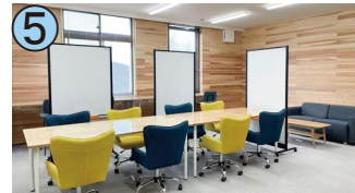
5 オフィスカつうら1

徳島県板野郡松茂町広島字三番地10番地/アクセス:広島バス停から徒歩で10分/年末年始休(12/29~1/4)臨時休館あり/9:00~20:00/☎088-699-5030