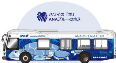
ホヌの背景にモンステラがあしらわれたデザイン