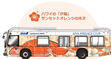
ホヌの背景にハイビスカスがあしらわれたデザイン