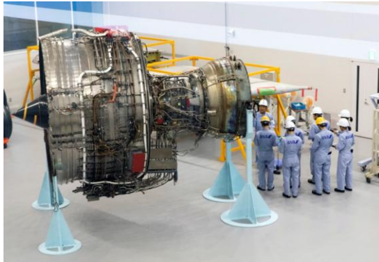
エンジンの整備訓練