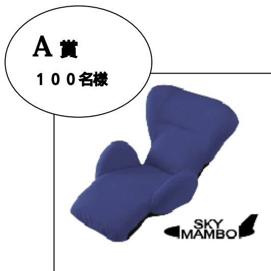
ソファ「スカイマンボウ」