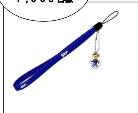
ANA オリジナルストラップ