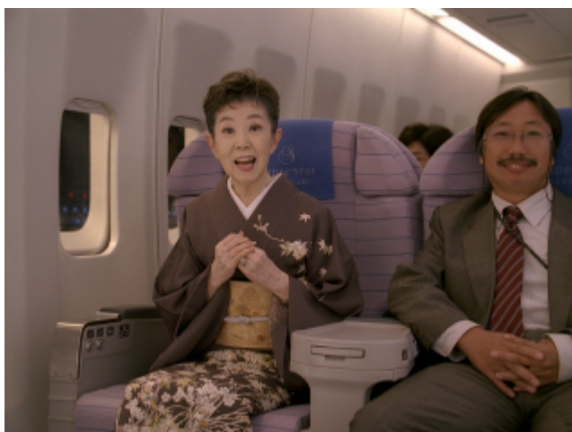
<「あれ、乗れちゃった」 森光子篇>