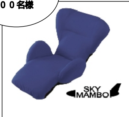
ソファ「スカイマンボウ」