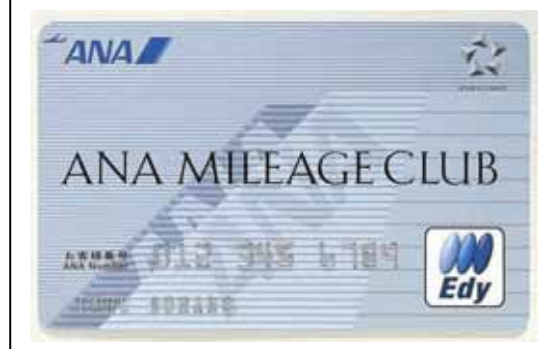
ANA マイレージクラブ Edy カード

* 会員数: 1,530 万人 提携店舗: 約 350 社 55,000 店舗 (2007 年 1 月末現在)