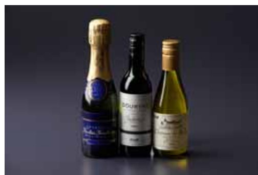
飲み物の一例(シャンパン・ワイン)