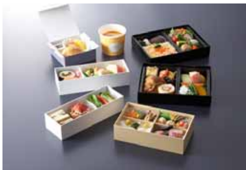
バリエーション豊富な機内食

機内でおくつろぎいただけるよう、おしぼりやスリッパに加えて、『プレミアムクラス』専用の毛布やヘッドフォンなどをご用意します。