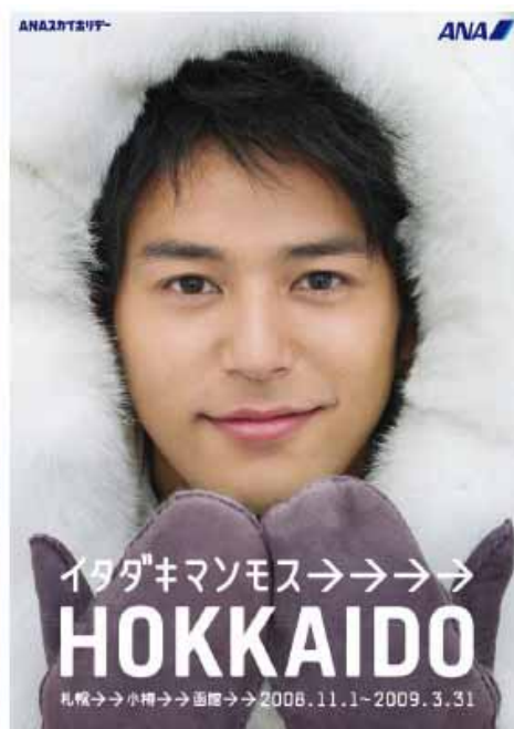
イタダキマンモス HOKKAIDO