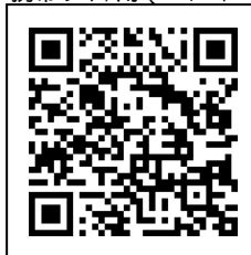
携帯サイト用QRコード

記者発表会・イベント等の内容 プレスリリース後の状況 皆様にお知らせしたい広報活動の掲載 プレスリリースの解説 等