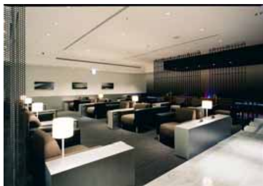
新千歳空港 イメージ図(2009年4月1日オープン)

福岡空港第3ターミナル(2009年1月オープン済み) 福岡空港第2ターミナル イメージ図(2009年4月1日オープン)