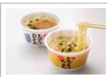
ホノルル線 「とびっきりおうどん」 「とびっきりらーめん」