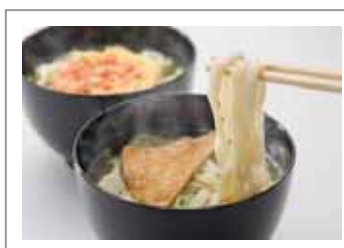
シンガポール・バンコク・ ホーチミンシティ・ムンバイ線 「生タイプうどん」

お食事提供以外の時間帯でご利用いただけます。ご希望のお客様は客室乗務員にお知らせください。