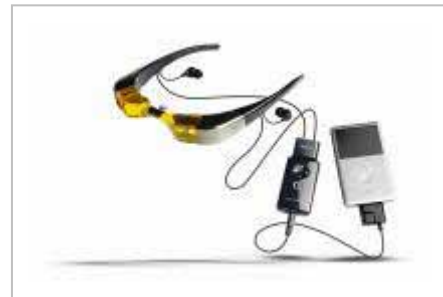
次世代パーソナルエンターテインメント「Myvu」

飛行時間の長い東京・大阪(伊丹・関西) = 沖縄線限定で、限定番組を搭載した iPod と次世代エンターテインメント「Myvu」(マイビュー) を有料レンタルいたします。眼鏡のように装着する「Myvu」なら、目の前に広がる自分だけの画面でショートムービー・ゴルフ番組・音楽ビデオクリップなど国内線機内でもゆったりと映像や音楽をオンデマンドでお楽しみいただけます。