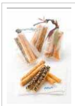
ANAオリジナル「チーズペッパーバー」

お食事提供以外の時間帯でご利用いただけます。ご希望のお客様は客室乗務員にお知らせください。