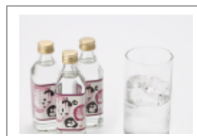
中国・韓国・台湾線 焼酎「加江田」