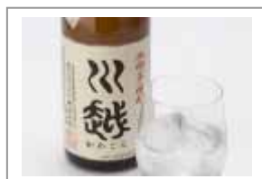
欧米路線(含ホノルル) シンガポール・バンコク ホーチミンシティ・ ムンバイ線