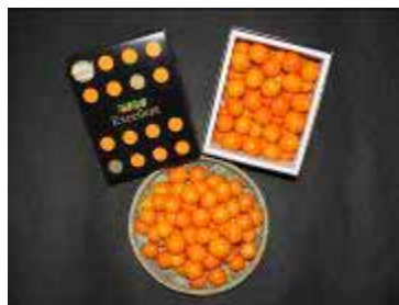
宮崎・高千穂郷のきんかん