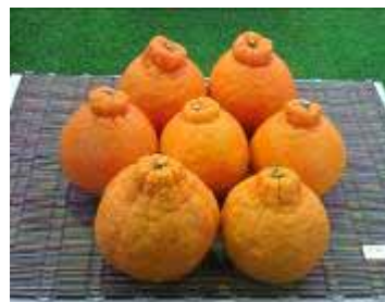
熊本・宇城市のしらぬい