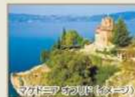
マケドニア(イメージ)

異なる民族、文化、宗教の十字路・バルカンの国々を訪れます。 ブルガリアからマケドニア、バルカンの秘境アルバニア、 モンテネグロを経て、アドリア海の真珠クロアチアまで、 珠玉の世界遺産の宝庫へご案内します。