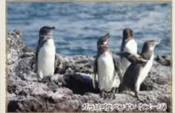
ガラパゴスのパン(イメージ)

スピリチュアルな光景が広がる神秘の国ミャンマーへ。 2012年就航、全38席のゆったりとしたANAビジネスジェットで行く