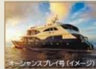
オーシャンズプレイ号(イメージ)

ダーウィンの進化論の起源、太古の風景が残るガラパゴス諸島。 世界初の世界自然遺産に登録された、未来へ残すべき宝の島々を訪れます。島巡りには、 2012年竣工の最新カタマラン(双胴船)「オーシャンズプレイ号」を日本で初めてチャーター。 14名様限定のクルーズが、プライベート感のある特別な旅にしてくれることでしょう。