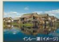
インレー湖(イメージ)

2012年10月に就航したANAビジネスジェット直行便を利用。 ミャンマーの4大名所のうち、2006年まで首都だったヤンゴン、 シアン高原の山々に囲まれたインレー湖、仏塔の都バガンを訪れます。 連泊を設定するなど、ゆったりとした日程でミャンマーをご案内します。