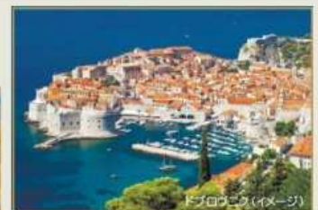
ドブロブニク(イメージ)

紅茶の里で世界遺産ダーズリン・ヒマラヤ鉄道「トイ・トレイン」に乗車。 イギリス統治時代の避暑地ダーズリンとインドの世界遺産を訪ねる