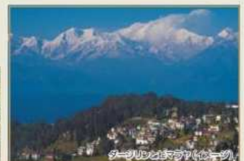
ダーズリンとアグラ(イメージ)