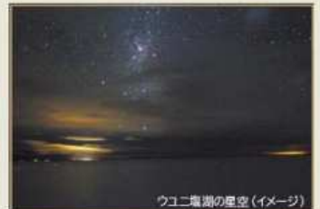
ウユニ塩湖の星空(イメージ)

異なる民族、文化、宗教の十字路、おだやかな風が吹くバルカン半島へ。 まだ見ぬ東ヨーロッパの珠玉の世界遺産と歴史都市をゆったりと巡る