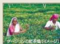
ダーズリンの紅茶畑(イメージ)

紅茶の生産地として有名なダーズリンは、イギリス植民地時代の避暑地。 ヒマラヤ山脈を遠くに望み、山岳地帯らしい風景と茶畑が広がります。 もちろん、インドの世界遺産が点在するデリーとアグラも訪れます。 長い休暇が取りやすいゴールデンウィークにも出発日を設定しています。