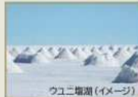
ウユニ塩湖(イメージ)

乾季のウユニ塩湖は、真っ白な塩の平原の上を歩くことができます。 新月のウユニ塩湖では、月明かりのない夜空に瞬く星に包まれるひとときを。 月に邪魔されることのない満天の星空をお楽しみください。 インカ帝国発祥の地であるチチカカ湖や太陽の島、ボリビアの世界遺産にも訪れる、見どころ満載の旅です。