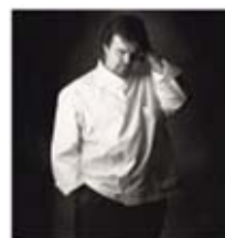
ピエール・エルメ氏