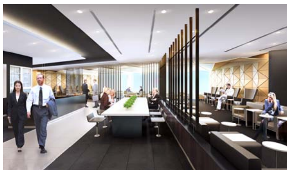
新設するANA SUITE LOUNGE

国際線ターミナルが拡張されるエリアにも、ANA SUITE LOUNGEおよびANA LOUNGEを新設します。現行のラウンジ同様、上質な空間にてお食事・シャワー・ビジネスコーナーなどの各種サービスをご利用いただけます。ご出発される搭乗口に応じて、お近くのラウンジをご利用ください。