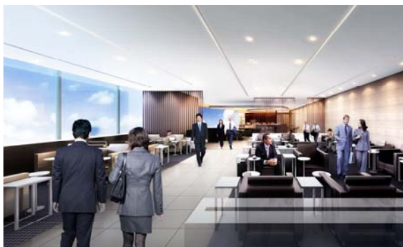
拡張後のANA SUITE LOUNGE

現行のANA SUITE LOUNGEおよびANA LOUNGEのフロアを大幅に拡張し、座席およびシャワーを増設します。お客様にはANAが誇るワンランク上の上質でゆとりあるおもてなし空間で、ゆったりと快適にお過ごしいただけます。