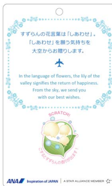
▲ANAグループ社員手作りのしおり