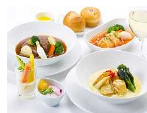
DINING h 洋食コース(例)