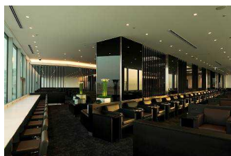
羽田空港 ANA ラウンジ