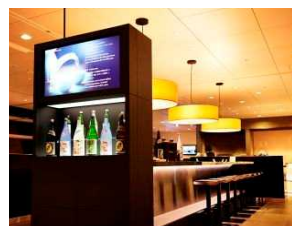
國酒コーナー(羽田空港ラウンジ)