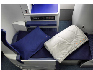
ビジネスクラスの寝具