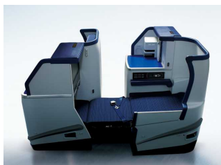
フルフラットビジネスクラスシート