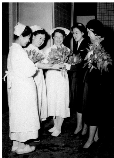
1956 年(第 1 回)