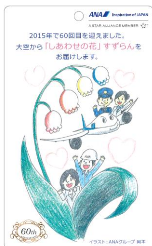
【表/ANA グループ社員のデザイン】