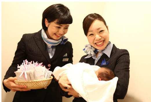
2014 年(第 59 回)