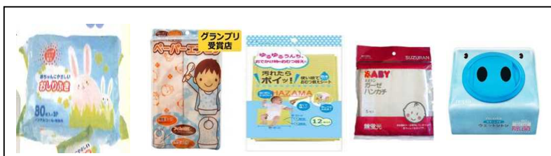
ベビーグッズ5点セット