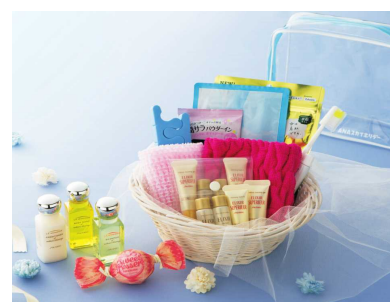
アメニティ10点セット