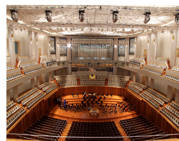
国家大劇院音楽庁