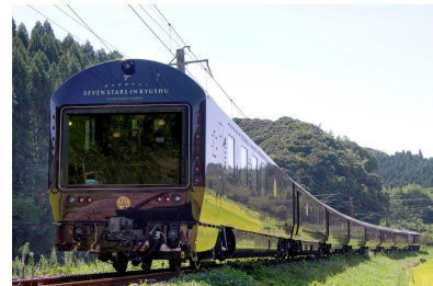
ななつ星 in 九州