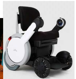
WHILL パーソナルモビリティ

また、慶成会老年学研究所監修のもと、「回想法」という手法を取り入れ、ご自身の「現在」「過去」「未来」を見つめ直す時間を共有します。普段は、ゆっくりと昔のことを思い出したり、話すこともなくなりがちですが、シニアの方々にとって、昔のことを思い出すことは穏やかでよい時間を過ごすこととなります。このような精神的な体験が、ツアー後の生活にとっても大きな影響を与えることとなります。また、イルカとの触れ合いのようなアクティビティを無理のない範囲で盛り込み、「できた！」「まだやれる！」という自信を取り戻していただく内容にしています。さらに、最大の特徴として、お客様4人に対して1人のANA客室乗務員経験者のスタッフなどが同行いたしますので、ANAの「おもてなしの心」でお客様をサポートいたします。