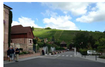
リクヴィル街並み

所要時間は約 2.5～3 時間をかけ日本語を学ぶ現地学生と一緒にウォーキングをします。