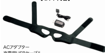
ACアダプター 充電用USBケーブル